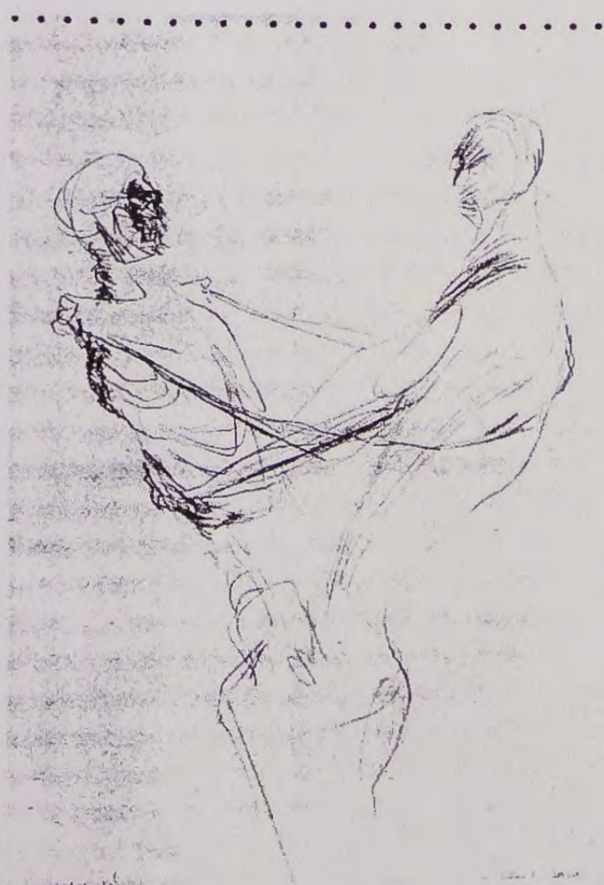
Ilona Staňková, Tanec se smrtí I, 2001, tužka, papír, 40 x 30 cm.

■ Petr Vaňous – Michal Jareš, kurátoři výstavy